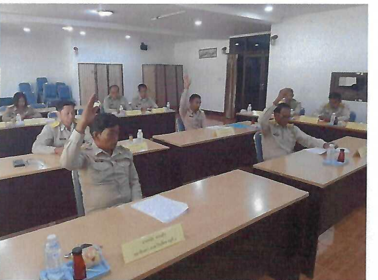
ประชุมสภาองค์การบริหารส่วนตำบลปึกเตียน สมัยสามัญ สมัยที่ ๑ ประจำปี ๒๕๖๙